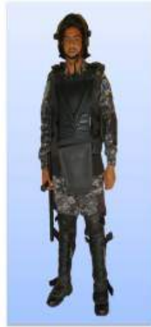
UNIFORME "D-1" (FATIGA) COMANDO DE OPERACIONES ESPECIALES- COBRA EQUIPO ANTIMOTIN