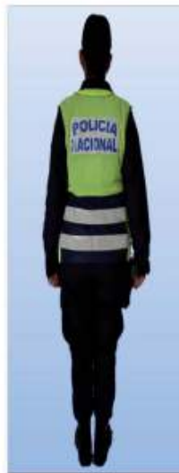
CHALECO POLICÍA DE TRANSITO