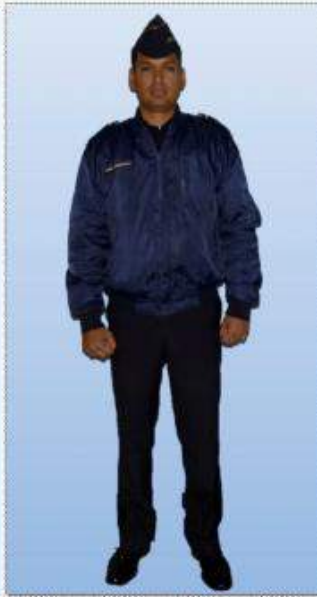
UNIFORME "C" (DIARIO), CON CHUMPA