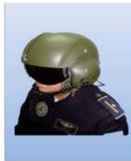
UNIFORME "E" OVER-ALL DE VUELO