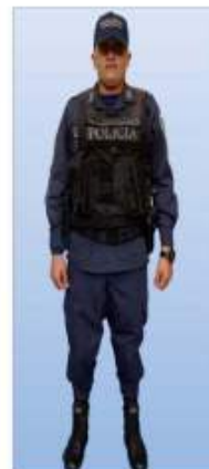
UNIFORME "D" FATIGA