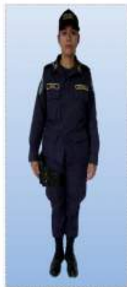
UNIFORME "D" FATIGA (PERSONAL PREVENTIVO)