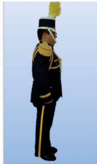
UNIFORME "A" GALA COLOR NEGRO

De carácter obligatorio para los señores oficiales asignados a la Academia Nacional de Policía.