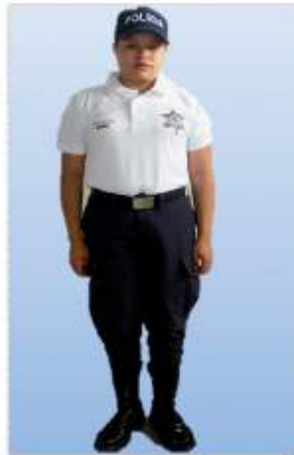
UNIFORME PARA POLICÍA DE TURISMO

Éste se usará en lugares turísticos, aeropuertos, fronteras terrestres, para eventos especiales tales como deportivos, ferias patronales.