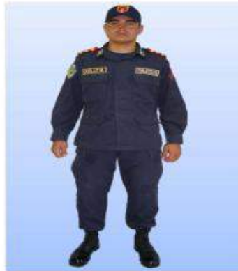
UNIFORME "D" FATIGA, PARA SEÑORITAS CADETES

De carácter obligatorio para las Señoritas y Caballeros Cadetes.