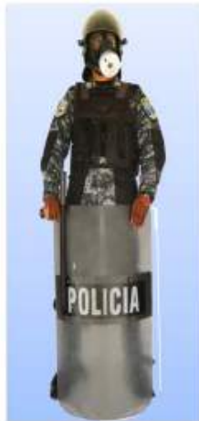
UNIFORME "D-1" (FATIGA) COMANDO DE OPERACIONES ESPECIALES- COBRA EQUIPO ANTIMOTIN GASEADOR