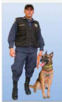
UNIFORME PARA GUÍAS-CANINOS