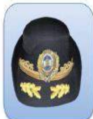
KEPI ESCALA SUPERIOR