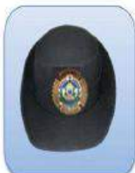
KEPI ESCALA BÁSICA