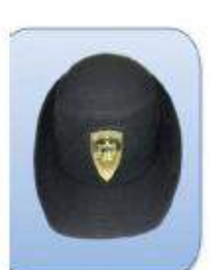
KEPI ESCALA ALFÉRECES Y CADETES