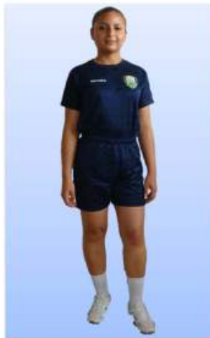
UNIFORME "F" (DE FÍSICA) PARA EL PERSONAL DE OFICIALES, ESCALA BASICA

De carácter obligatorio para todos los miembros de la Policía Nacional