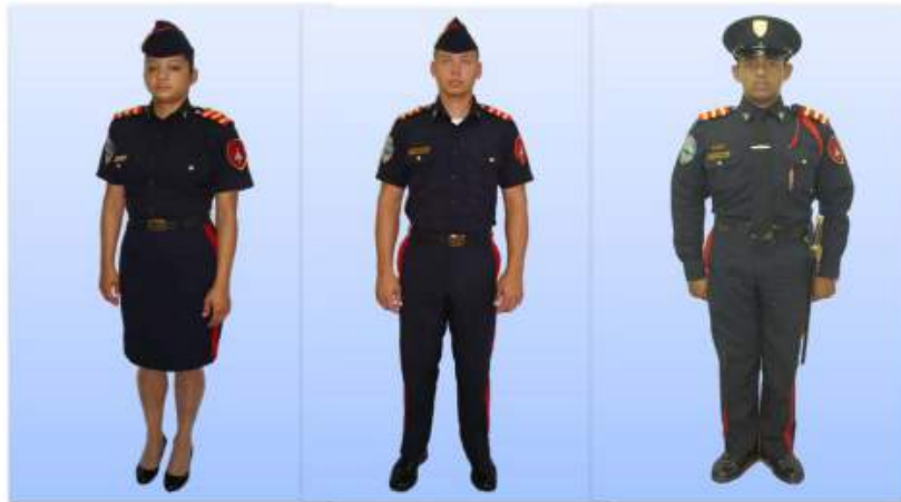
UNIFORME "C" DIARIO MANGA CORTA, PARA SEÑORITAS CADETES