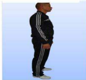
UNIFORMES "F" (FISICA) PARA CABALLEROS CADETES