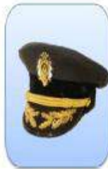
KEPI ESCALA EJECUTIVA