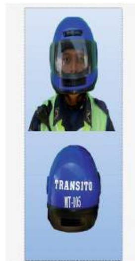
CASCO PARA LA POLICÍA DE TRÁNSITO