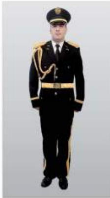
Uniforme "A" Gala color negro.