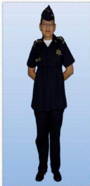
UNIFORME "C" (DIARIO) PARA PERSONAL EN ESTADO DE EMBARAZO