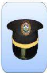
KEPI ESCALA INSPECCIÓN