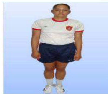
UNIFORMES "F" (FISICA) PARA CABALLEROS Y SEÑORITAS CADETES