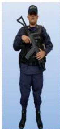
UNIFORME "D" FATIGA (PERSONAL PREVENTIVO)