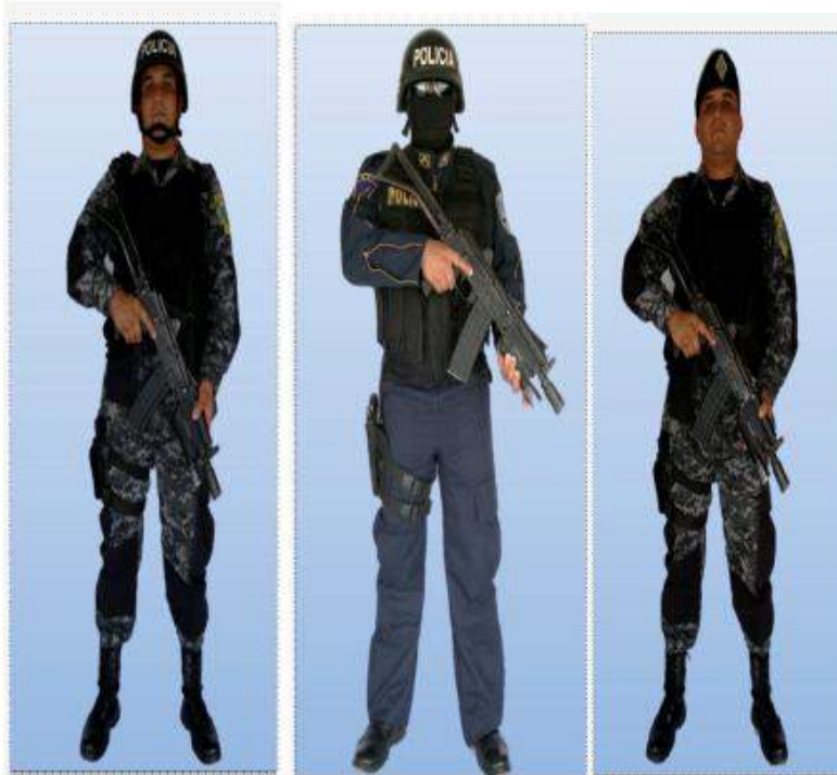
UNIFORME "D-1" (FATIGA) COMANDO DE OPERACIONES ESPECIALES - COBRA, EQUIPO TÁCTICO PARA OPERACIONES URBANAS

Tendrá las mismas características del Uniforme "D-1" éste llevará adicionalmente, casco balístico con forro de tela negra, gafas protectoras tipo comando, en vez de pasamontañas se utilizará pintura para mimetizar, chaleco antibalas, cinturón y penera, yatagán colgado del cinturón al lado izquierdo, guantes negros, protectores de codos y rodillas, chaleco táctico.