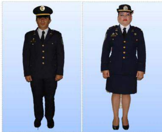
UNIFORME "B" SOCIAL MASCULINO