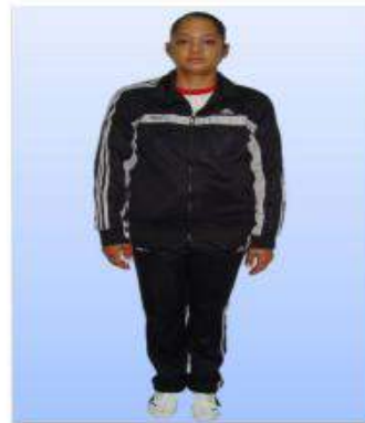
UNIFORMES "F" FISICA, PARA SEÑORITAS CADETES