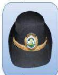
KEPI ESCALA INSPECCIÓN