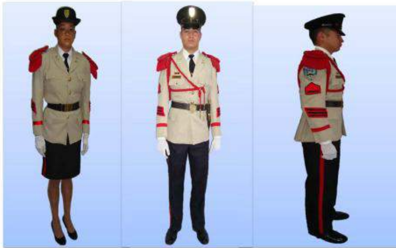
UNIFORME "A" GALA, PARA SEÑORITAS CADETES

De carácter obligatorio para las señoritas y caballeros cadetes y alférez.