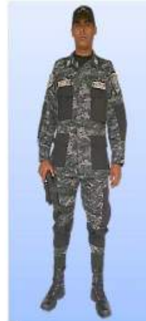
UNIFORME "D-1" (FATIGA) COMANDO DE OPERACIONES ESPECIALES- COBRA USO DIARIO