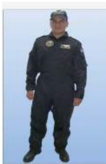
UNIFORME "E" OVER-ALL DE VUELO

De carácter obligatorio para todos los miembros de la Policía Nacional que conforman esta Unidad.