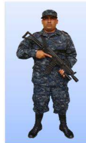
UNIFORME "D-2" (FATIGA) TIGRES