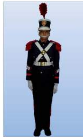
UNIFORME "B" SOCIAL, PARA CABALLEROS Y SEÑORITAS CADETES

De carácter obligatorio para las Señoritas y Caballeros Cadetes.