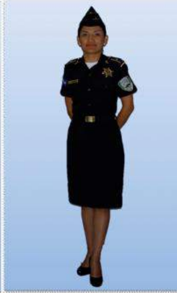
UNIFORME "C" (DIARIO) CON FALDA