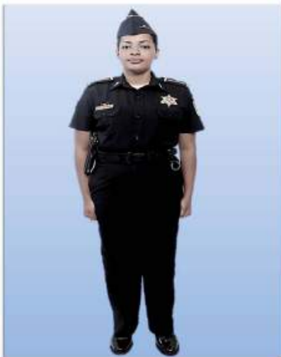
UNIFORME "D-1" DIARIO, PARA SERVICIO

De carácter obligatorio para todos los miembros de la Policía Nacional.