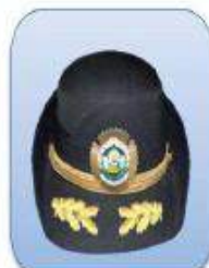
KEPI ESCALA EJECUTIVA