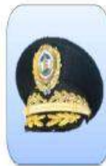
KEPI ESCALA SUPERIOR

Para los hombres la altura donde está ubicado el escudo será de mayor tamaño que la parte anterior y siempre llevará visera.