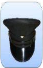
KEPI ESCALA BÁSICA