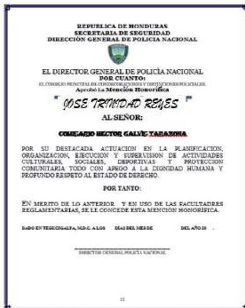
Mención Honorífica "José Trinidad Reyes"

demostradas en el cumplimiento de sus acciones éticas y morales, al igual que con su compromiso, disciplina y responsabilidad.