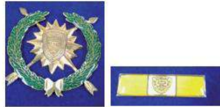
Medalla de Perseverancia en el Servicio en Bronce