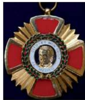
Condecoración "Procer Don Dionisio de Herrera"

La Condecoración "CRUZ DE LOS SERVICIOS DISTINGUIDOS" será impuesta al personal de la Policía Nacional de Honduras, en ceremonia especial que se realizará el día 15 de enero; para el personal de instituciones congéneres extranjeras será otorgada e impuesta por el señor Director General de la Policía Nacional según su criterio y en ceremonia especial.