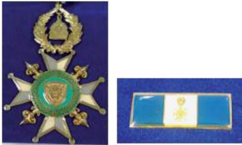
Condecoración "Gran Procer Marco Aurelio Soto"

General de la Policía Nacional previo informe del señor Subdirector de Bienestar Social, la cual será impuesta en ceremonia especial.