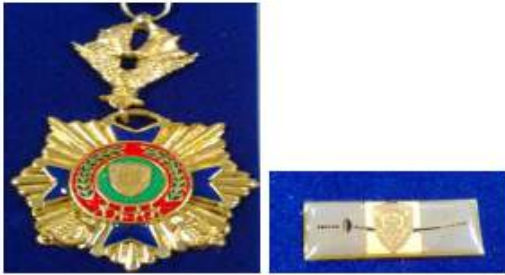
Condecoración "Espadín Policial de Alto Honor en Oro"

La condecoración "PROCER JOSE TRINIDAD CABAÑAS" será impuesta en ceremonia especial que se realizará el día 15 de enero.