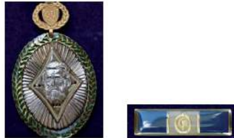
Condecoración "Procer Jose Trinidad Cabañas"

La Condecoración "GRAN PROCER MARCO AURELIO SOTO" será impuesta en ceremonia especial que se realizará el día 15 de enero.