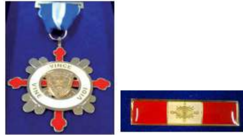
Medalla de "Honor a la Excelencia Académica"

Las Medallas PERSEVERANCIA EN EL SERVICIO (Oro, Plata y Bronce) serán impuestas en ceremonia especial que se realizará el día 15 de enero.