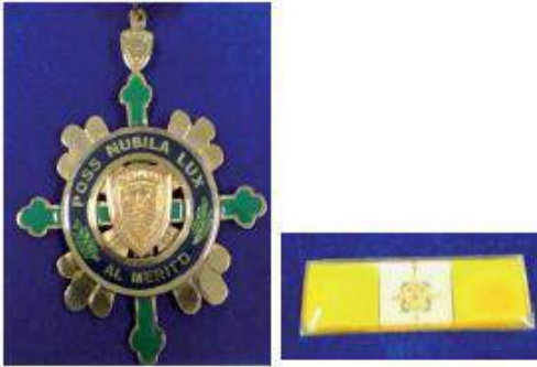
Medalla de "Catedrático Ejemplar"