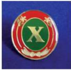
Distintivo Orquidea de Ópalo