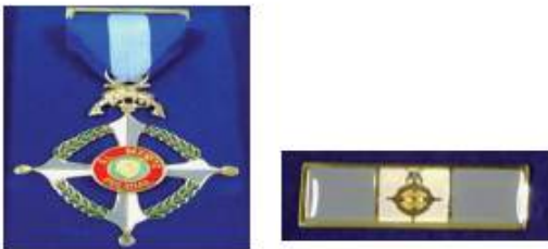
Condecoración "Cruz de los Servicios Distinguidos"

círculo de color verde perla de tipo convexo en el cual estará grabado con líneas doradas el monograma de la Policía Nacional, la joya penderá de una cinta de 70 mm de alto por 45 mm de ancho con tres banderas verticales. Esta condecoración constará de su respectivo gafete, con unas dimensiones de 30 mm de largo por 10 mm de ancho, y sus extremos de 10 mm, cada lado de esmalte azul y en el centro de esmalte blanco, con borde rojo a su alrededor y entre los espacios con divisiones de esmaltes; en la división blanca llevará una miniatura de la condecoración. La condecoración "ESTRELLA MERITO A LA UNIDAD POLICIAL" del color de la misma será impuesta en ceremonia especial que se realizará el día 09 de junio.