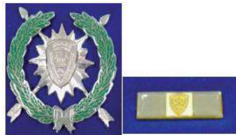
Medalla de Perseverancia en el Servicio en Plata

La Medalla de Perseverancia en el Servicio en Bronce consistirá en laureles color verde de 2 hojas en forma de U con 55 mm por extremo de color bronce, en su parte inferior llevará un nudo de 10 mm de color bronce con un par de flechas de 55 mm, en cuya intersección estará un sol de 45 mm color bronce, con 16 aristas 8 mayores de 5 mm y 8 menores de 3 mm; en el centro estará un monograma de la Policía Nacional con un diámetro de 15 mm en color bronce. Esta medalla constará de su respectivo gafete, con unas dimensiones de 30 mm de largo por 10 mm de ancho, dividida en 3 secciones de 10 mm cada una, de color bronce en los lados y en el centro de color blanco con borde de color verde con llevará una miniatura de la condecoración del color de la medalla, un monograma de la Policía Nacional de color amarillo con rayos de brillo dorados.