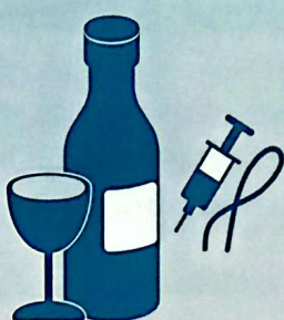
Ingesta de alcohol y abuso de drogas